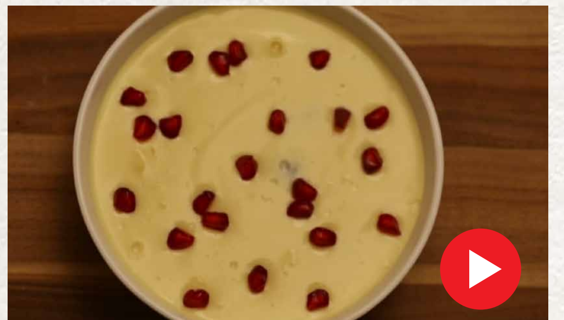
பழ கஸ்டர்டு Fruit Custard