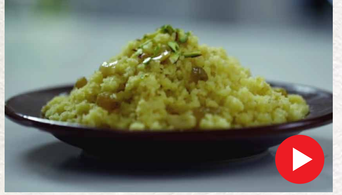
பால் ரவா கேசரி அல்வா Milk Rava Kesari Halwa