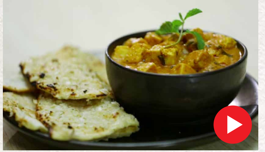
பன்னீர் டிக்கா Paneer Tikka