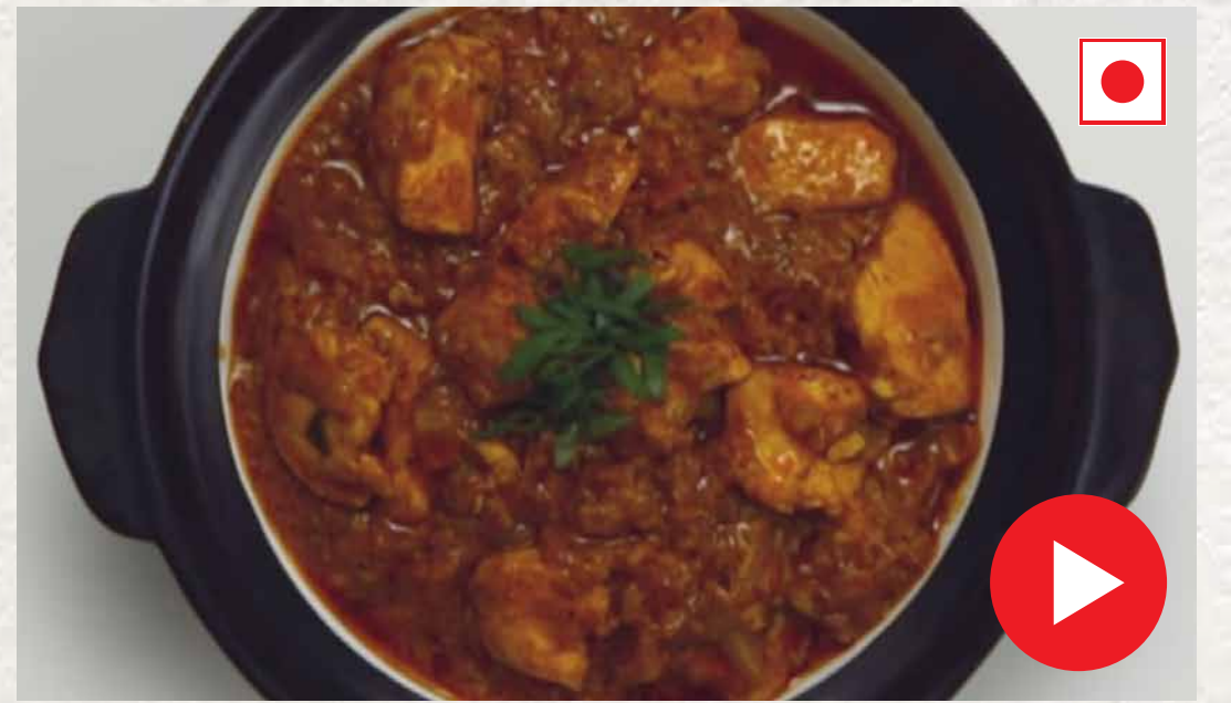
சிக்கன் டிக்கா Chicken Tikka