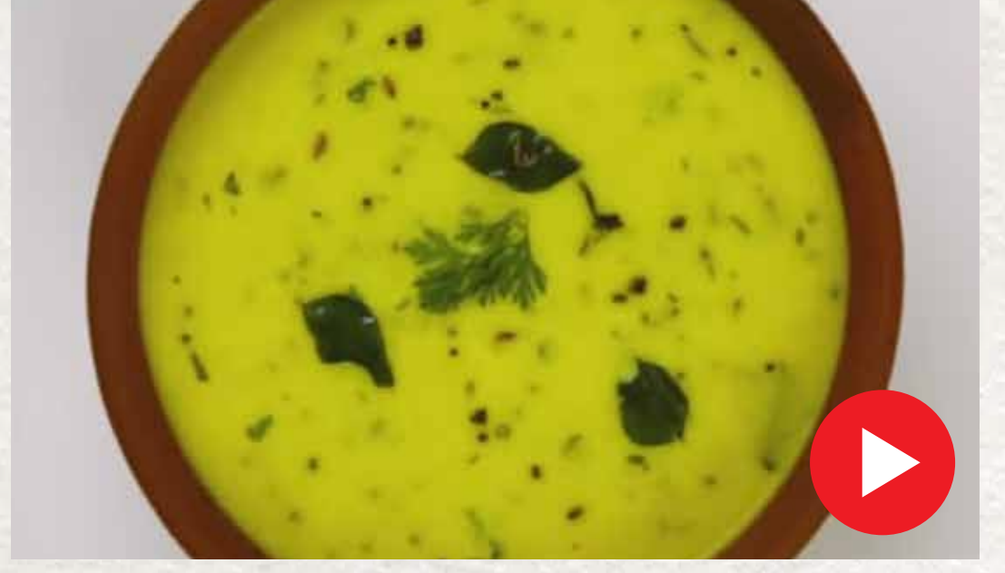
மோர் குழம்பு Mor Kuzhambu