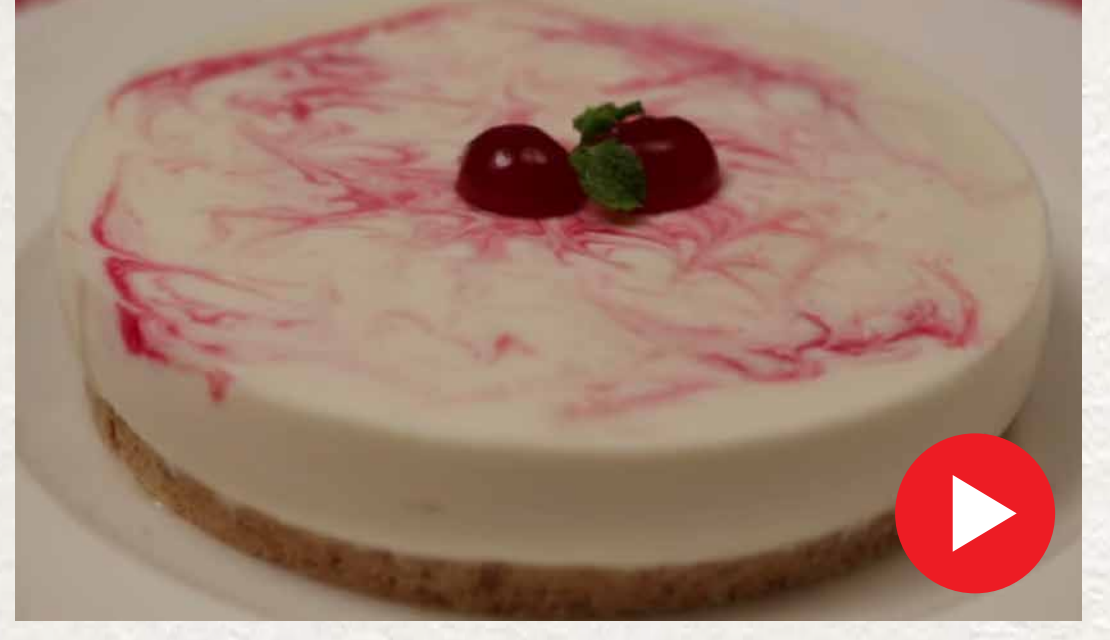
சீஸ் கேக் Cheese Cake

எளிமையாக வீட்டிலேயே சமைக்கும் உணவு வகைகள்