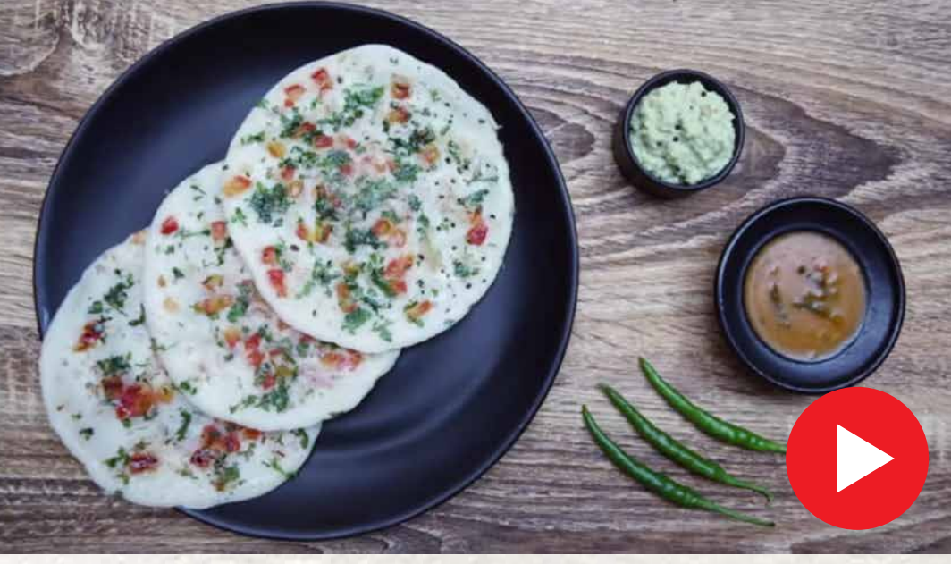
பட்டர் வெங்காயம் தக்காளி ஊத்தப்பம் Butter Onion Tomato Uttappam