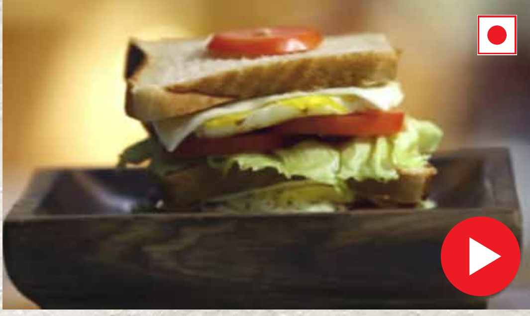
ஃபிரைடு எக் சான்ட்விச் Fried Egg Cheese Sandwich