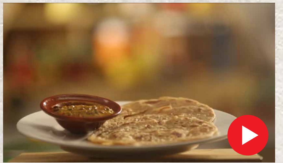
லச்சா பராத்தா Lachcha Paratha