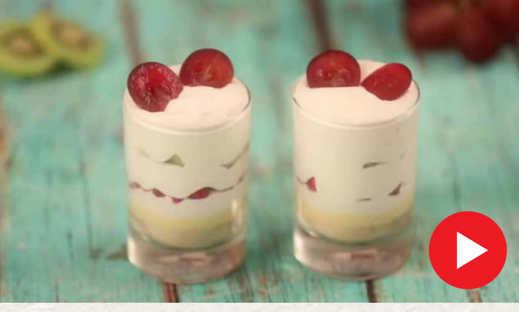
ஃபுரூட் டிரிஃபிள் Fruit Trifle