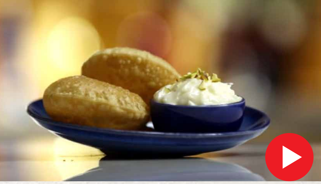
ஸ்ரீகண்ட் பூரி Shrikhand Poori