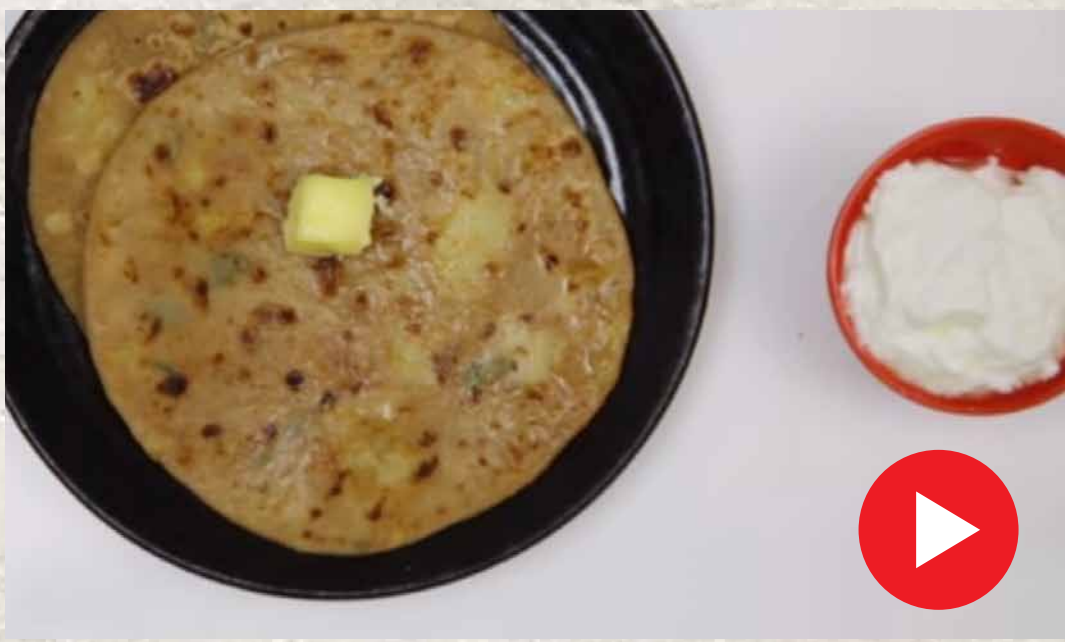
ஆலு பராத்தா Aloo Paratha