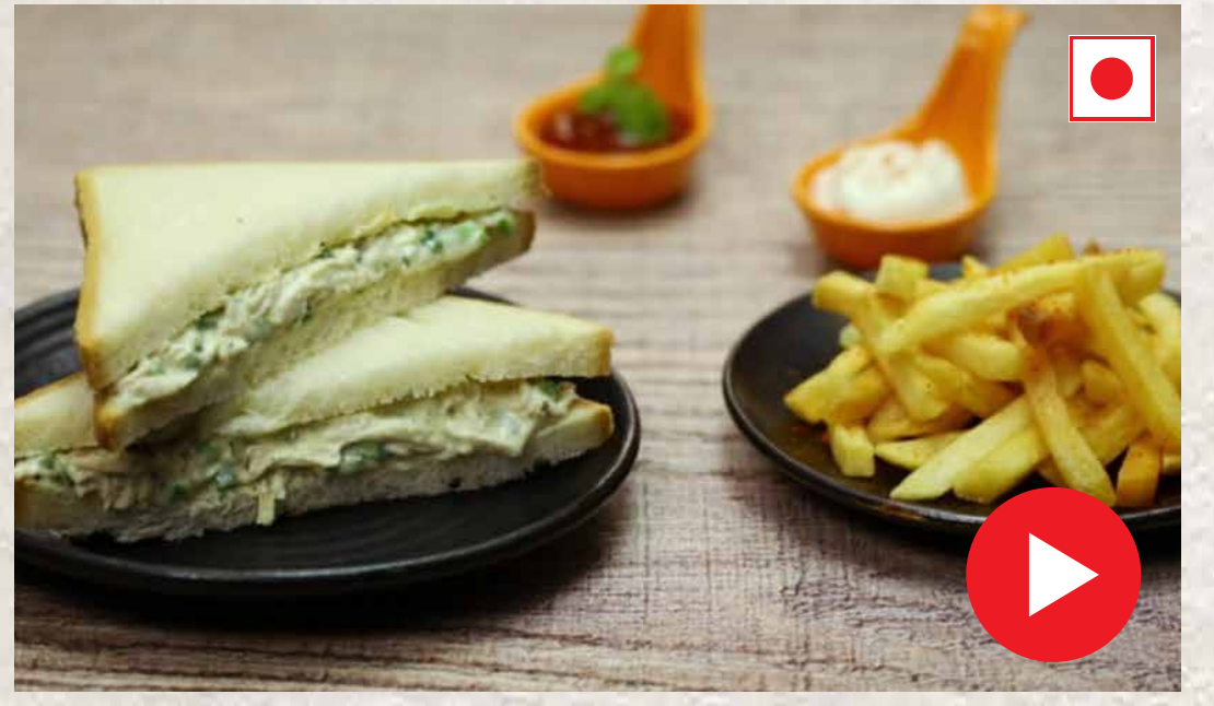
சிக்கன் சான்ட்விச் Chicken Sandwich