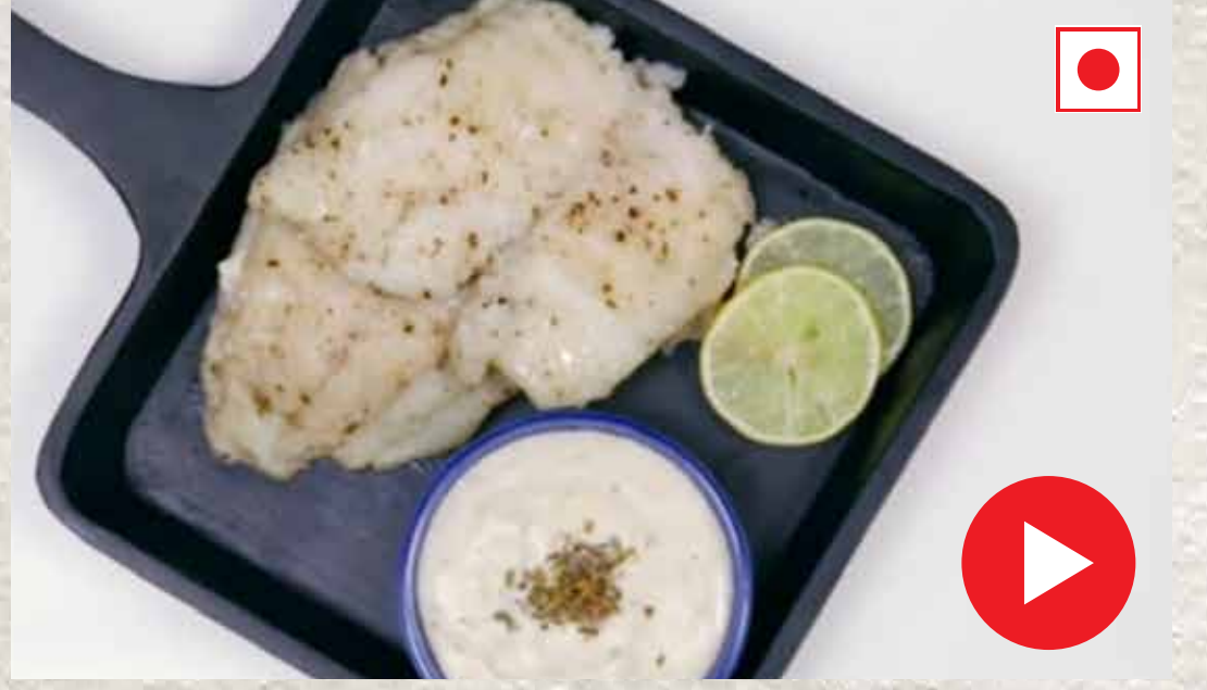
கார்லிக் சீஸ் சாஸுடன் சமைத்த மீன் Fish With Garlic and Cheese Sauce