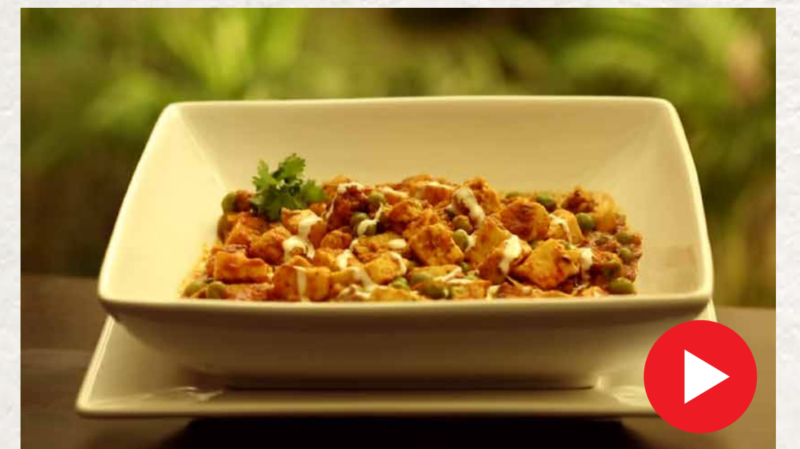
மட்டர் பன்னீர் Mattar Paneer