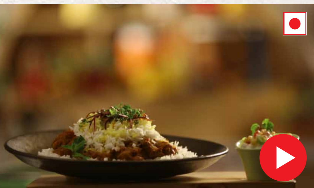
சிக்கன் பிரியாணி Chicken Biryani