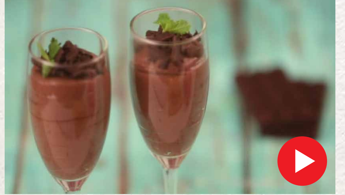
சாக்லேட் மூஸ் Chocolate Mousse