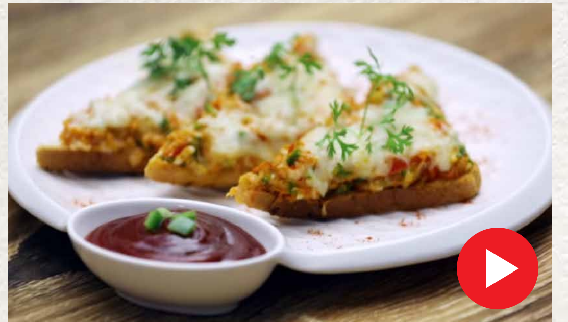
சில்லி சீஸ் டோஸ்ட் Chilli Cheese Toast