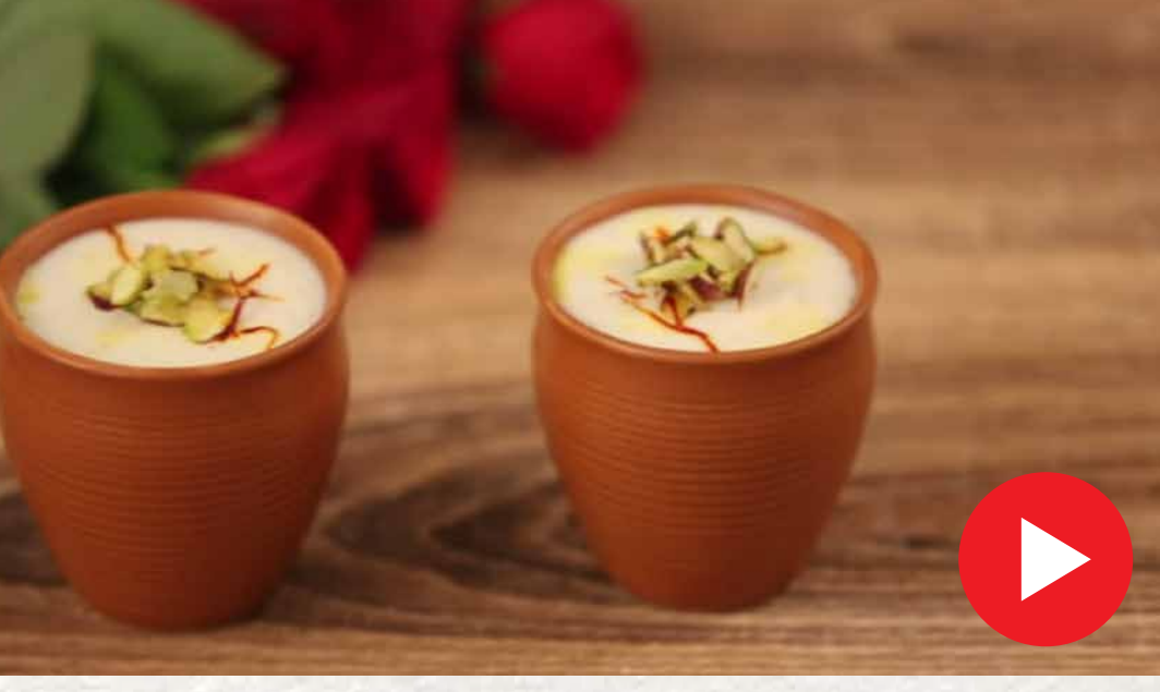
மிஷ்டி டோய் Mishti Doi