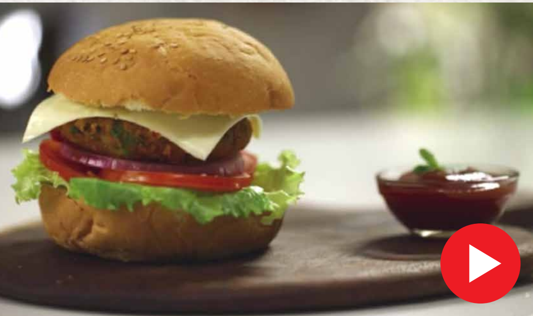
வெஜ் பர்கர் Veg Burger