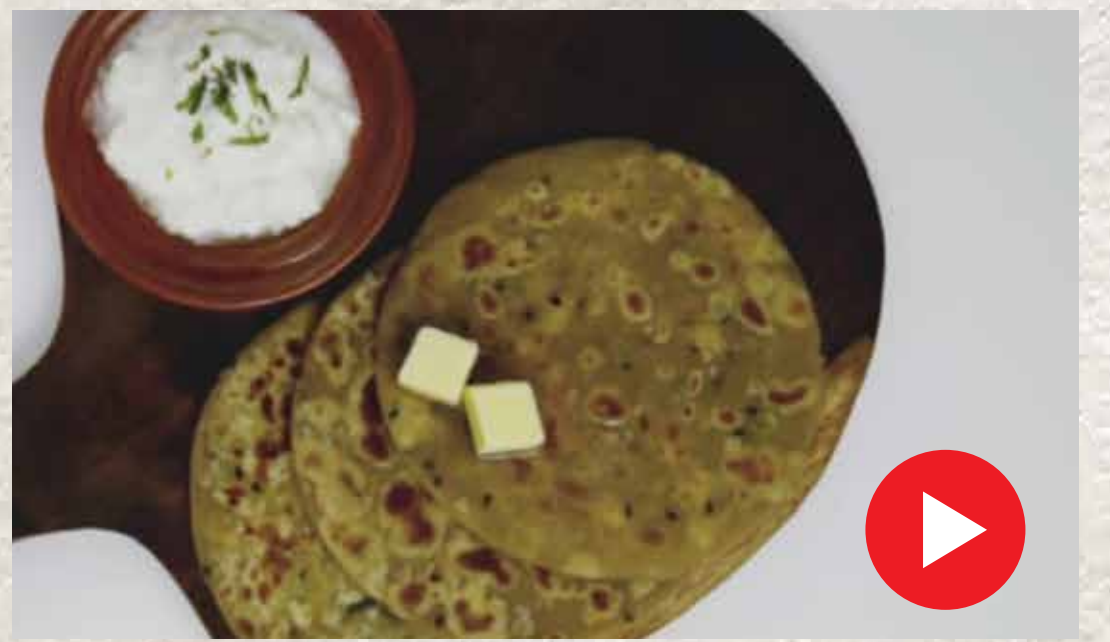
பன்னீர் பராத்தா Paneer Paratha