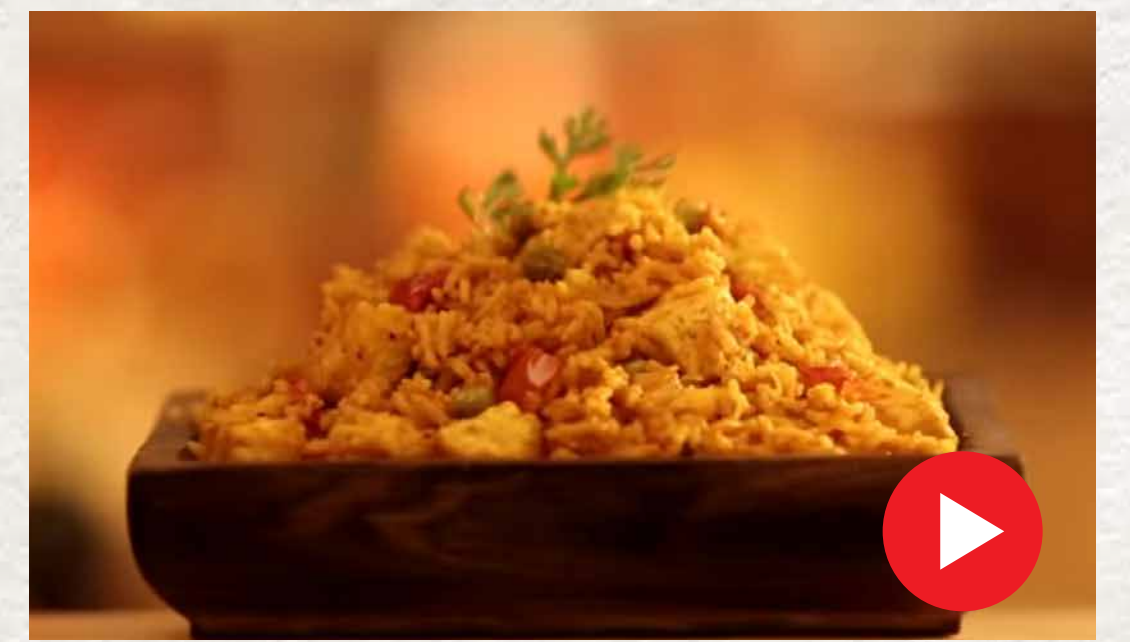
பன்னீர் புலாவ் Paneer Pulav