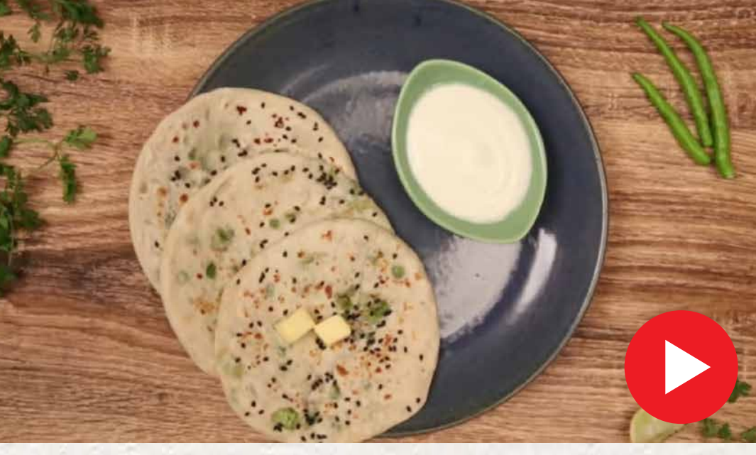
மட்டர் பன்னீர் குல்ச்சா Mattar Paneer Kulcha