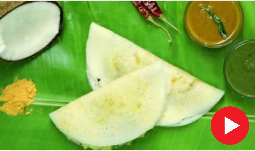
சீஸ் மசாலா தோசை Cheese Masala Dosa