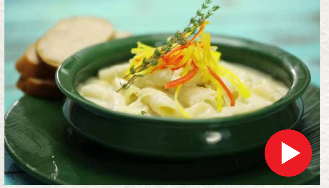
ஒயிட் சாஸ் பாஸ்தா White Sauce Pasta