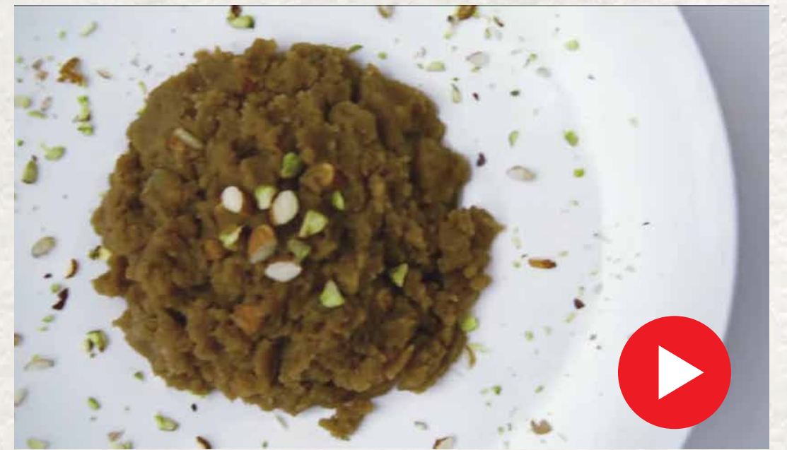
கோதுமை அல்வா Godhumai Halwa