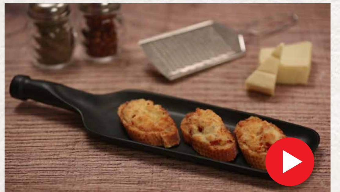
இத்தாலிய புருஷெட்டா Italian Bruschetta