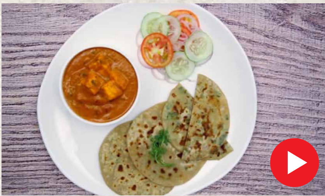
சீஸ் பராத்தா Cheese Paratha