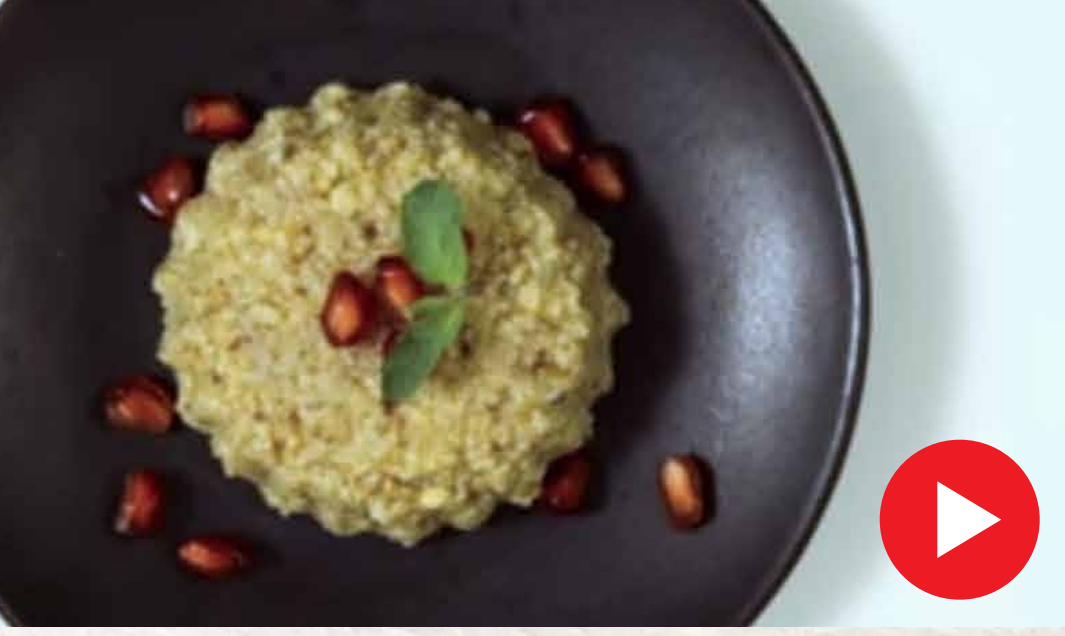
பால் கேக் Milk Cake