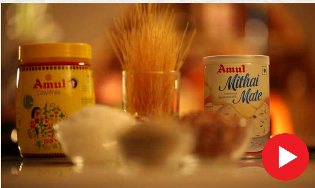
சேமியா பாயாசம் Semiya Payasam