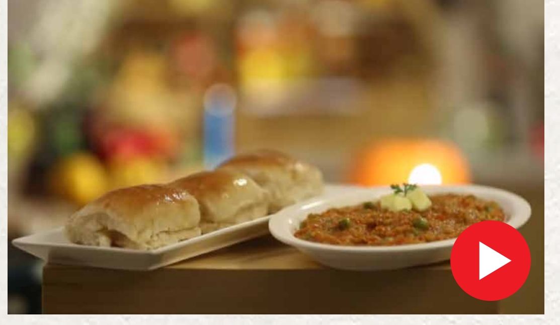
பாவ் பாஜி Paav Bhaji