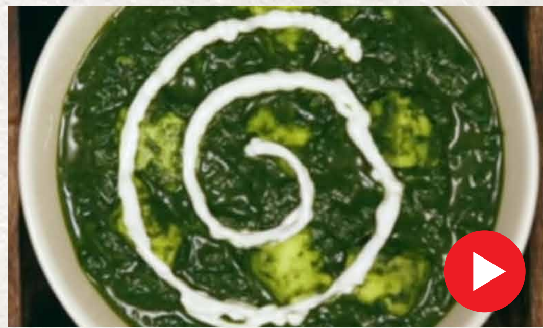
பாலக் பன்னீர் Palak Paneer