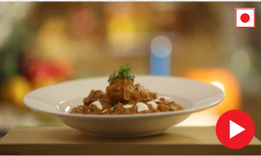
பட்டர் சிக்கன் Butter Chicken