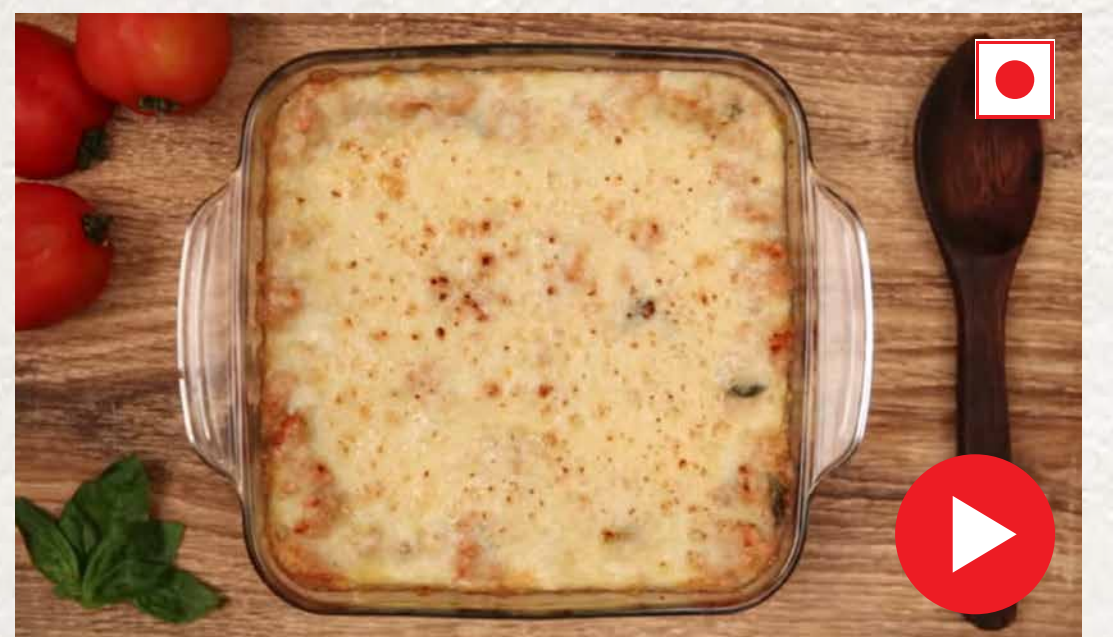
சிக்கன் லசான்னியா Chicken Lasagna