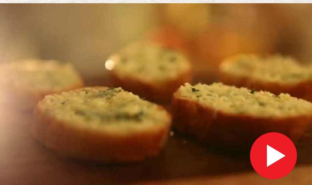
கார்லிக் பிரட் Garlic Bread