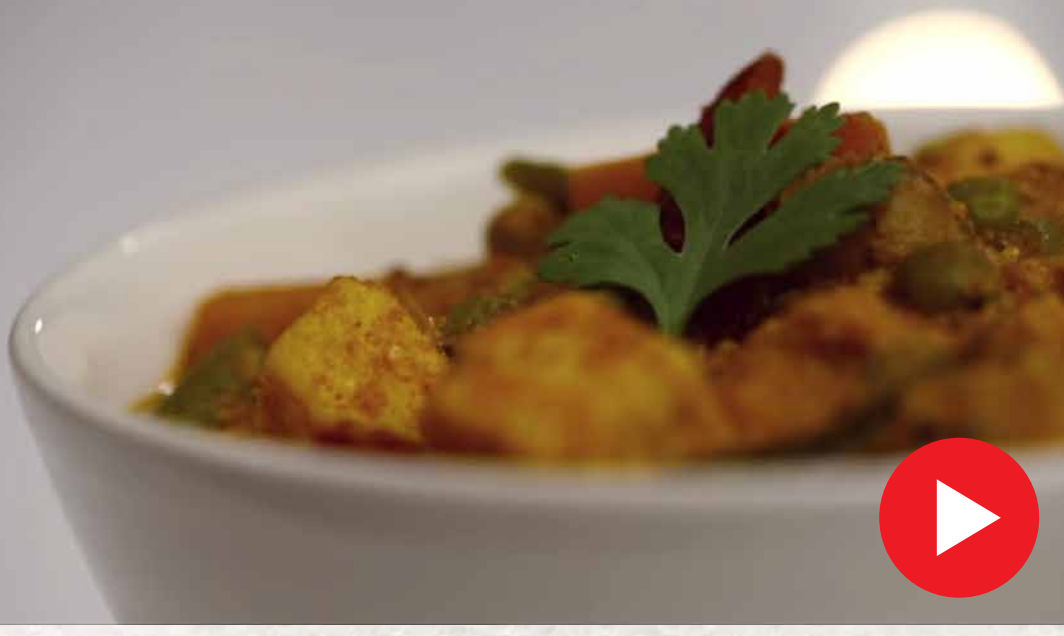
வெஜிடபிள் மக்கன்வாலா Vegetable Makhanwala