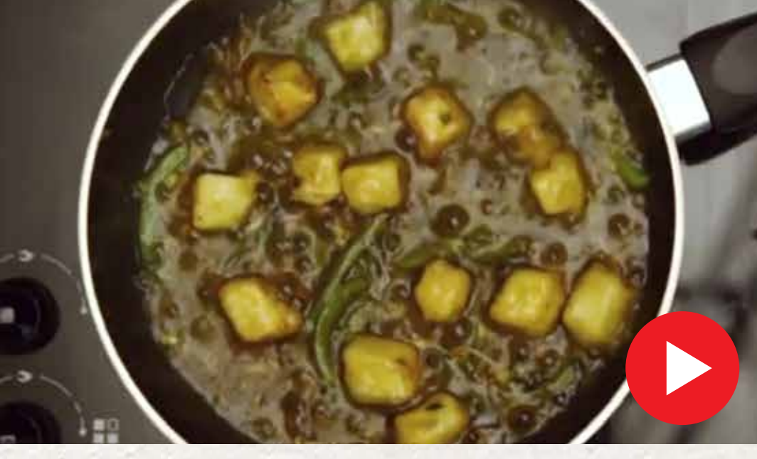
சில்லி பன்னீர் Chilli Paneer