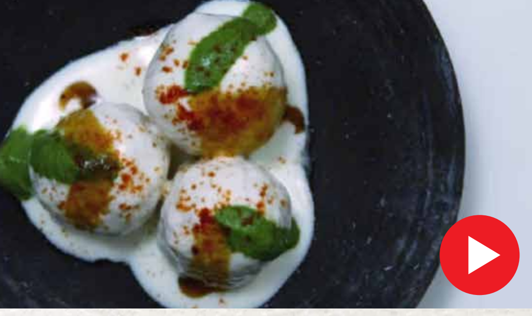
கார்லிக் பிரட் Thayir Vadai