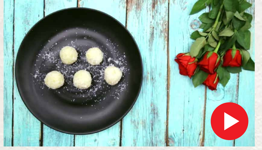
தேங்காய் லட்டு Thengai Ladoo