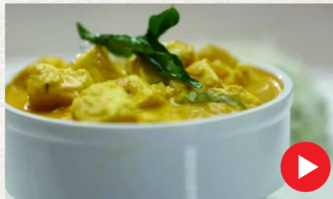
ஷாஹி பன்னீர் Shahi Paneer