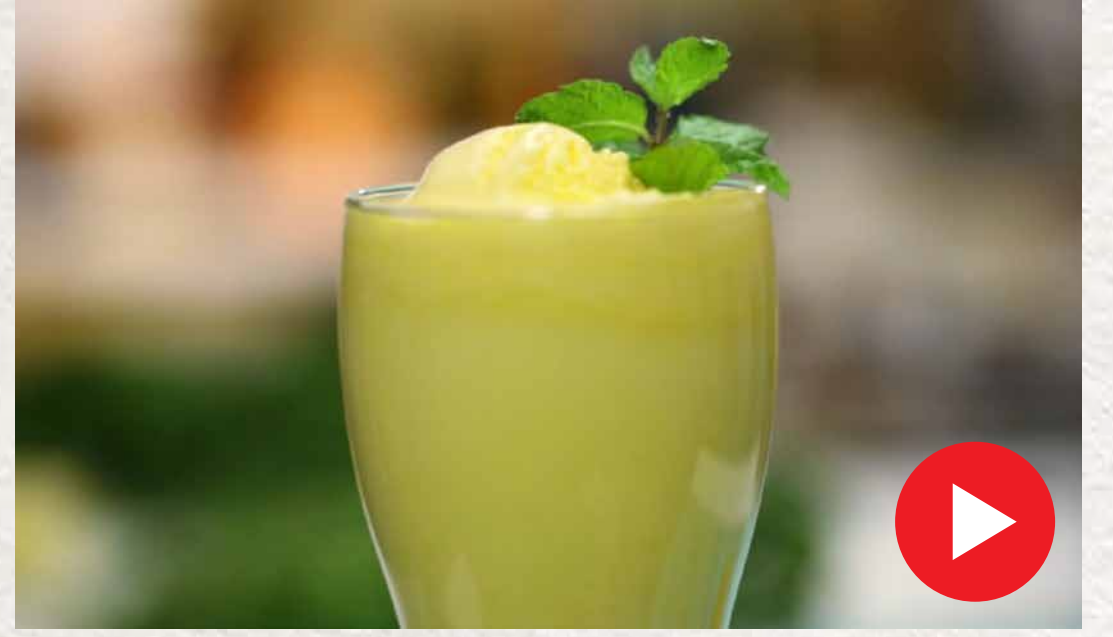
மாம்பழ மில்க் ஷேக் Mango Milkshake