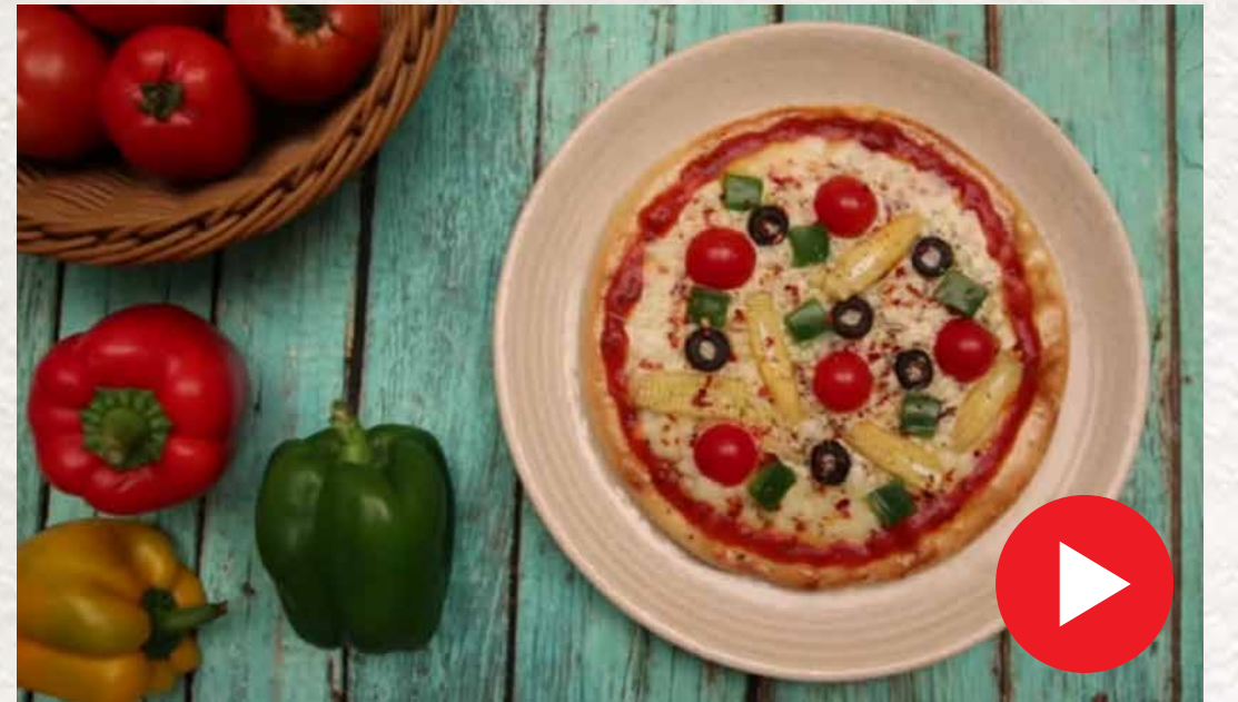
வெஜ் பீட்ஸா Veg Pizza