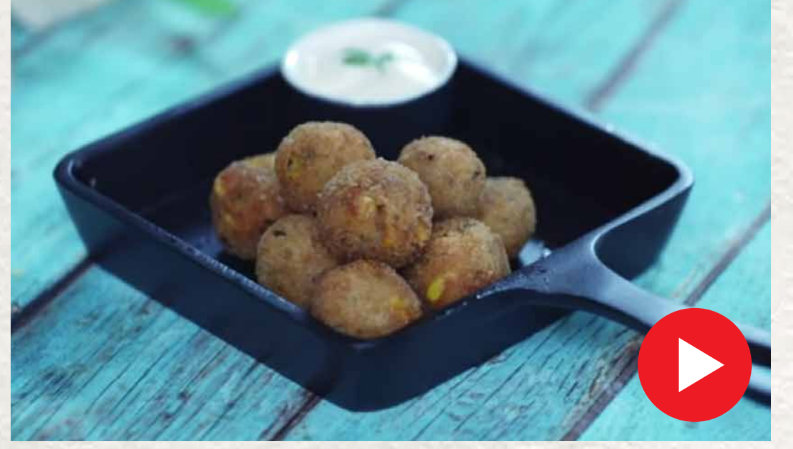
சீஸ் கார்ன் உருண்டை Cheese Corn Urundai