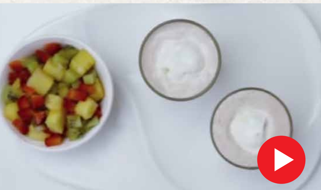
ஃபுரூட் கிரீம் Fruit Cream