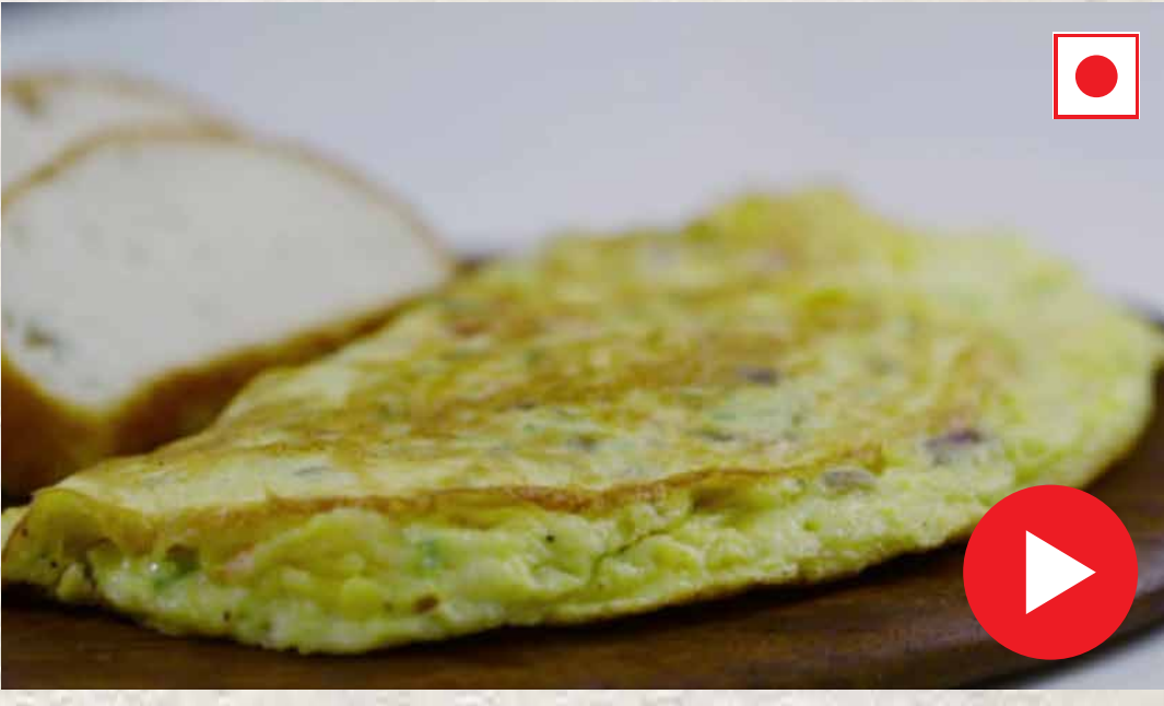
சீஸ் ஆம்லெட் Cheese Omelette