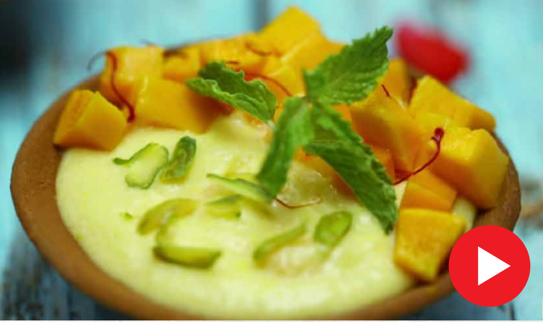
மாம்பழ ஃபிர்னி Mango Phirni