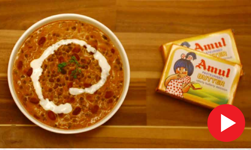
தால் மக்கனி Dal Makhani