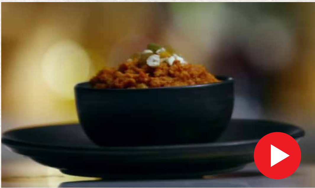
கேரட் அல்வா Carrot Halwa